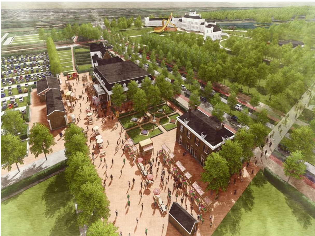
De Parade met hotel, restaurant, evenementenlocatie en nieuw parkeerterrein

Het Paleis biedt allerlei mogelijkheden voor zakelijke activiteiten, al of niet besloten. Maar ook het publiek krijgt de ruimte om het Paleis en het Park te bekijken en van de actuele thema's te genieten. Steeds wisselende bedrijven en (kennis)instellingen manifesteren zich voor kortere of langere tijd in de Paleisvleugels. In de 'Proeftuin' vormen historische gebouwtjes als het sportpaviljoen, het speelhuisje, de watertoren, het ch  let en de ijskelder   n een aantal nieuwe tijdelijke follies visueel aantrekkelijke, interactieve onderdelen van Made By Holland .